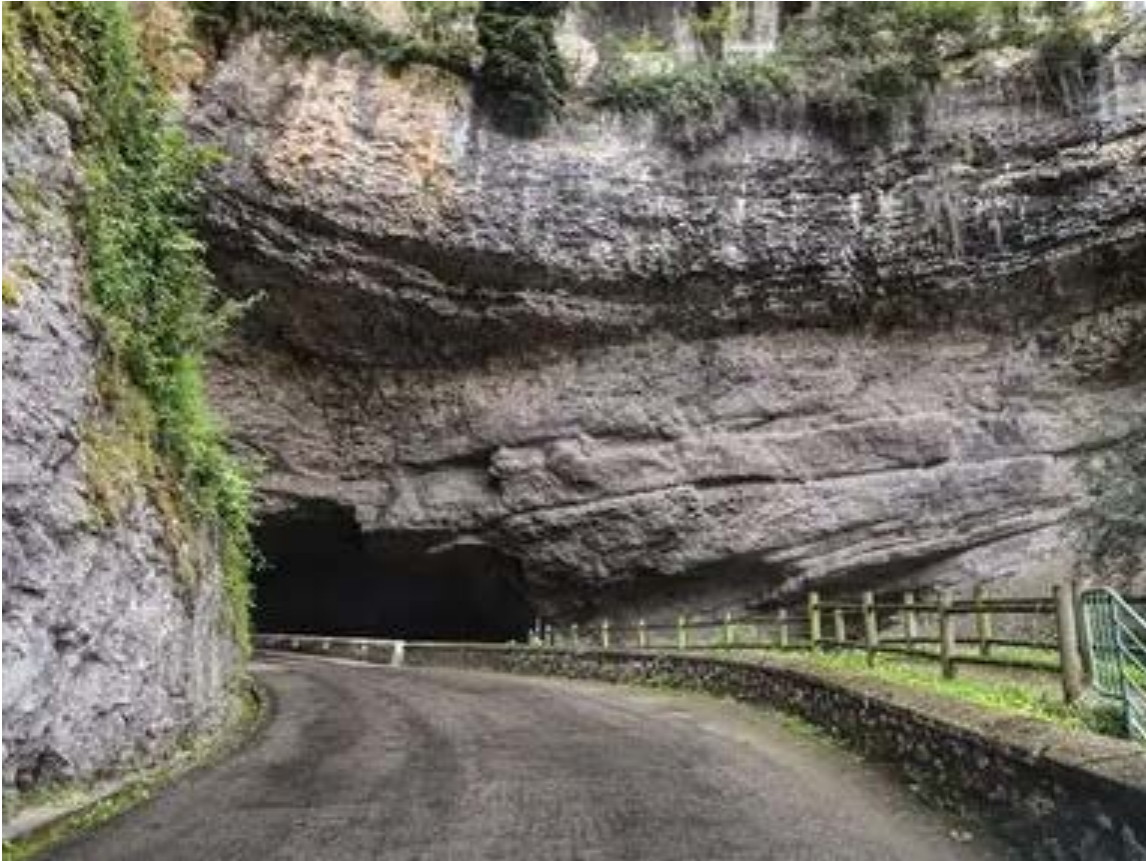
Entrée nord de la grotte