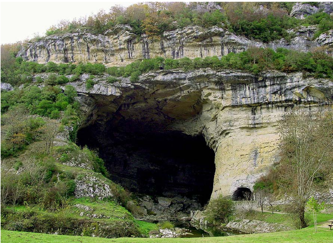
Entrée sud de la grotte