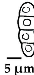
Fig. 3. Aspect des spores d' Opegrapha reactiva (dessin de Enrico Mangini).

Le taxon est initialement décrit par Alstrup et Hawksworth (1990) sous le nom de Kalaallia reactiva Alstrup et Hawksw. Par la suite Etayo et Diederich (dans Etayo et Sancho, 2008) proposent une nouvelle combinaison et nomme l'espèce Opegrapha reactiva (Alstrup et Hawksw.) Etayo et Diederich.