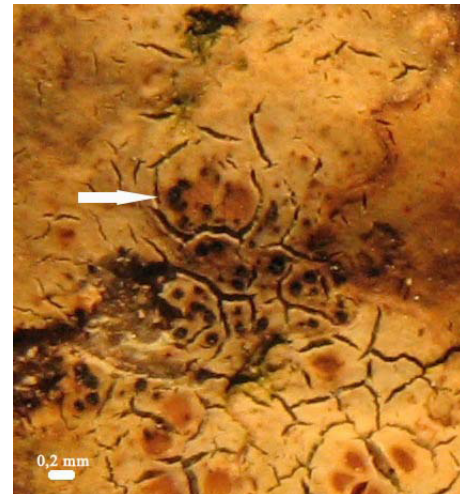
Fig. 1 (à gauche) et fig. 2 (à droite). Périthèces noirs lâchement regroupés (flèche blanche) sur le thalle brun d' Hymenelia lacustris .

des septa (fig. 3), de 17-20 x 5 – 8 \mu m de dimension.