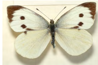
Face dorsale femelle

- Gonepteryx rhamni (Linné, 1758) – Le Citron