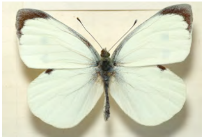
Face dorsale mâle

- Pieris brassicae (Linné, 1758) ♂ et ♀ – La piéride du chou